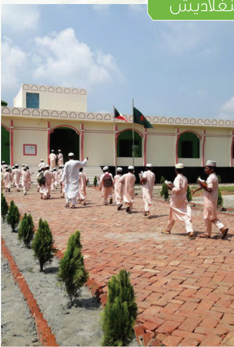
المساحة م 2 عدد الطلاب نوع المدرسة التكلفة