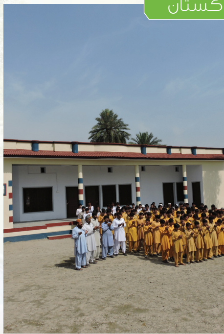
المساحة م 2 عدد الطلاب نوع المدرسة التكلفة