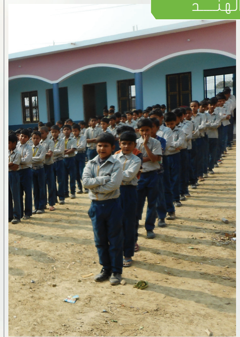
المساحة م 2 عدد الطلاب نوع المدرسة التكلفة